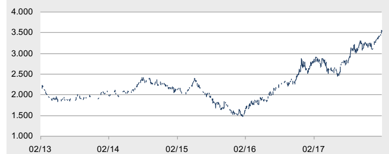
Performance (srovnání): 1 rok